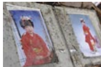
PHOTONEXT 2011 ギャラリー展示作品から